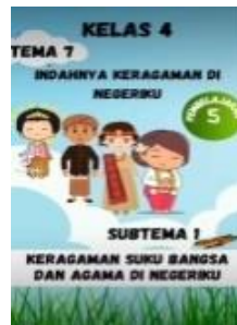
Gambar 1 Tampilan Sampul Depan Media pembelajaran Tik Tok

Dalam proses pembuatan desain gambar yang ada di sampul depan terlihat gambar animasi keragaman agama. Ukuran desain yang dipilih dalam pembuatan media pembelajaran ini memiliki resolusi custom tik tok 1080 x 1920 piksel. lalu kemudian digabungkan menjadi satu agar siswa mudah menonton video pembelajaran tik tok. Media ini dirancang dalam bentuk digital dengan bantuan aplikasi canva dengan menggunakan jenis huruf Atalic , Sedangkan untuk ukuran tulisan disesuaikan dengan kebutuhan