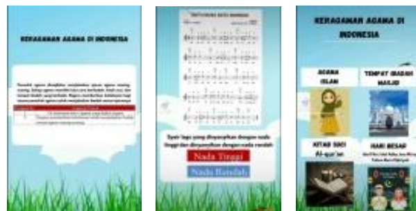
Gambar 2 Tampilan Isi Materi Pada Media pembelajaran Tik Tok

Tampilan ini tentang materi yang berjudul keragaman agama di negeriku dengan 3 muatan pelajaran yaitu bahasa Indonesia, menuliskan gagasan pokok dan pengetahuan baru dalam bacaan, pada muatan SBDP yaitu menjelaskan tempo serta tinggi rendah nada dalam lagu. Kemudian pada muatan PPKn yaitu menjelaskan tentang keberagaman agama di Indonesia, mengenali tempat ibadah, kitab suci, dan hari besar agama-agama.