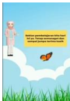
Gambar 3 Tampilan Penutup Pada Media pembelajaran Tik Tok