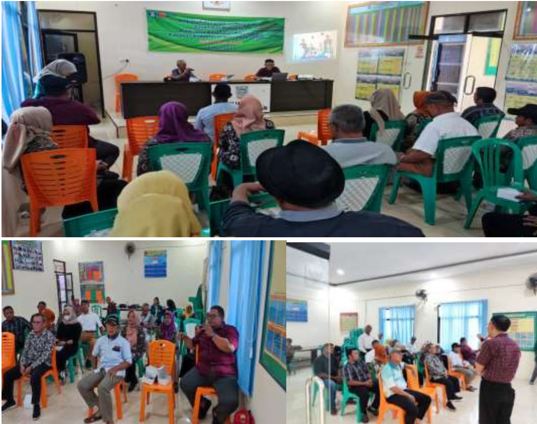
Gambar 1. Dokumentasi Kegiatan pengabdian