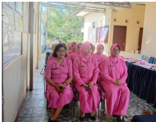
Gambar 3. Hasil Dokumentasi Impelementasi

Proses selanjutnya pada perancangan solusi dari permasalahan yang didapatkan, tim pengabdian masyarakat memberikan beberapa pilihan aplikasi keuangan yang terdapat pada perangkat hp baik android maupun apple. Diantara aplikasi tersebut adalah Buku Kas dan Manajemen keuangan. Sehingga dari aplikasi keuangan tersebut dilakukan pendampingan atau bimbingan untuk menggunakan aplikasi tersebut. Sehingga dalam penerapannya dapat dihasilkan beberapa laporan yang dapat digunakan bagi anggota Bhayangkari untuk menentukan perencanaan keuangan selanjutnya. Dalam pencapaian tersebut merupakan salah satu tujuan bersama salah satu program yang terdapat pada Bhayangkari adalah Bhayangkari Perduli, dimana program tersebut tentu tidak terlepas dari manajemen keuangan. Berikut ini pada Gambar 3 merupakan hasil dokumentasi pada hari kedua dimana dilakukan implementasi dari solusi yang telah diberikan.