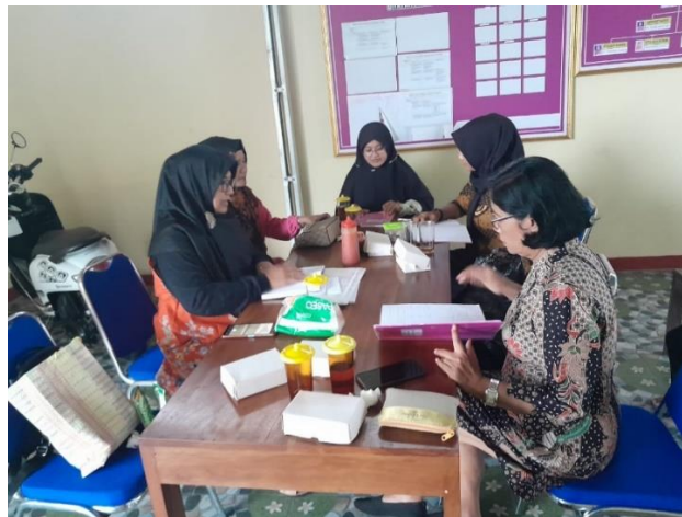
Gambar 2. Hasil Dokumentasi Diskusi

Setelah melalui tahap identifikasi masalah, perancangan solusi, implementasi solusi, dan evaluasi hasil, berikut pada Gambar 2 merupakan dokumentasi pada saat proses identifikasi masalah dengan membuka dan menganalisis dokumen-dokumen keuangan yang selama ini digunakan dalam mencatat maupun mengelola keuangan dalam organisasi Bhayangkari. Dalam hal ini tidak terbatas pada dokumen yang ditemukan namun juga hasil wawancara atau tanya jawab terhadap pribadi anggota Bhayangkari dalam menerapkan pengelolaan keuangan sehari-hari. Dalam hal ini peserta terdiri dari ibu ketua ranting Jatiyoso dan beberapa pengurus Bhayangkari.