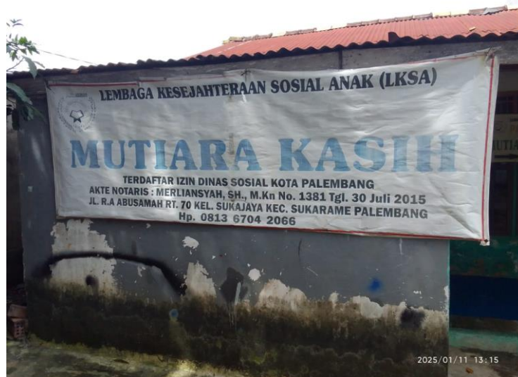
Gambar 2. Struktur Organisasi Panti Asuhan Mutiara Kasih

Panti asuhan “Mutiara Kasih” merupakan salah satu panti asuhan yang memberikan pelayanan kesejahteraan sosial bagi anak yatim, piatu, miskin maupun anak-anak terlantar lainnya. Panti Asuhan Mutiara Kasih telah berdiri sejak tahun 2015 dengan visi yaitu membantu menanggulangi anak yatim piatu, terlantar dan anak jalanan agar dapat mengenyam Pendidikan sekolah, Pendidikan agama dan pembinaan mental.