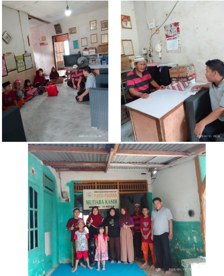
Gambar 3. Proses Pelaksanaan Sosialisasi

Berdasarkan hasil wawancara diketahui bahwa anak-anak Pantia Asuhan Mutiara Kasih sebenarnya memiliki motivasi dan disiplin belajar yang baik namun terdapat keterbatasan yang kadang-kadang dapat mengganggu atau menurunkan motivasi dan disiplin belajar anak-anak Pantia Asuhan Mutiara Kasih untuk itulah diperlukan peran pengasuh untuk memotivasi anak-anak di Pantia Asuhan Mutiara Kasih. Hasil ini sejalan dengan beberapa kajian yang dilakukan yang menyimpulkan bahwa peranan motivasi dan kedisiplinan sangat penting dan sangat dipengaruhi oleh peran pendamping/pengasuh (Karuniawan & Hidayat, 2024; Putri et al., 2024; Sri Astuti Eka Putri et al., 2024; Utami & Yusri, 2023).